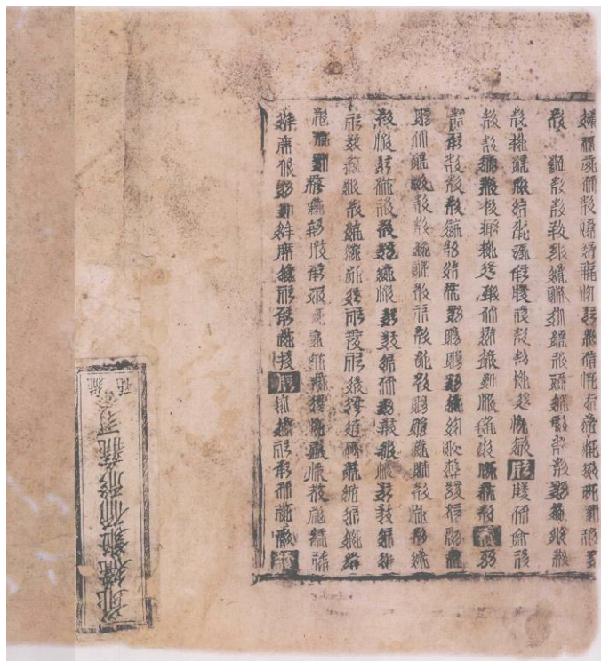
K2: 129, 圖 34

文中「注」和「竟」字中的文字代表文中的注疏（符合《大正藏》版的「細字」部分文字）。這個文獻為《圓覺經略疏鈔》的西夏譯文的情況早已為高山杉所公佈（原圖公佈者未鑒定本子的屬性）。據以上的考證，西夏譯本與《大正藏》本接近，只有一處明顯錯誤：西夏語「故」心王者「言語道斷」漏了漢語版中的「知」字。第三段落「佛性者【】造惡」者雖然無疑問符合漢語「如雲「能造」等者」之說，但西夏語明顯把「能造」寫成「造惡」。因為西夏語翻譯很少有異於底本，可見以上兩點錯誤或疏漏可能屬於漢語底本本身的問題。第三段落有部分文字（【】無，自體本來【】是淨情。「南雅」【】普照者，起先知【】《起信》文，但指空體）不見在《大正藏》版本。從此可知，西夏語《圓覺經略疏鈔》的底本非為現存《大正藏》校勘過的漢語底本，也就是並非平江府仲希整理過的版本。目前的假設則是，西夏《圓覺經略疏鈔》的漢語底本為西北地方單獨流傳的版本。這說明，西夏流傳部分華嚴禪文獻實際上與北宋「華嚴復興」屬於不同脈絡。同時，高山杉確定《華嚴金獅子章》、《修華嚴還源觀》雖然接近於北宋晉水淨源（1011-1088）修復過的本子，但其漢語底本與今存漢語版本不全同，可以進一步假設西夏華嚴學的來源是多元的，包括雲間和華北二種傳統 28 。